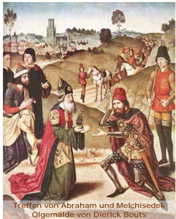
Treffen von Abraham und Melchisedek Ölgemälde von Dierick Bouts

26 Aber sie haben nicht auf mich gehört und ihr Ohr nicht geneigt; und sie haben ihren Nacken verhärtet, haben es ärgergemacht als ihre Väter.“ Elb