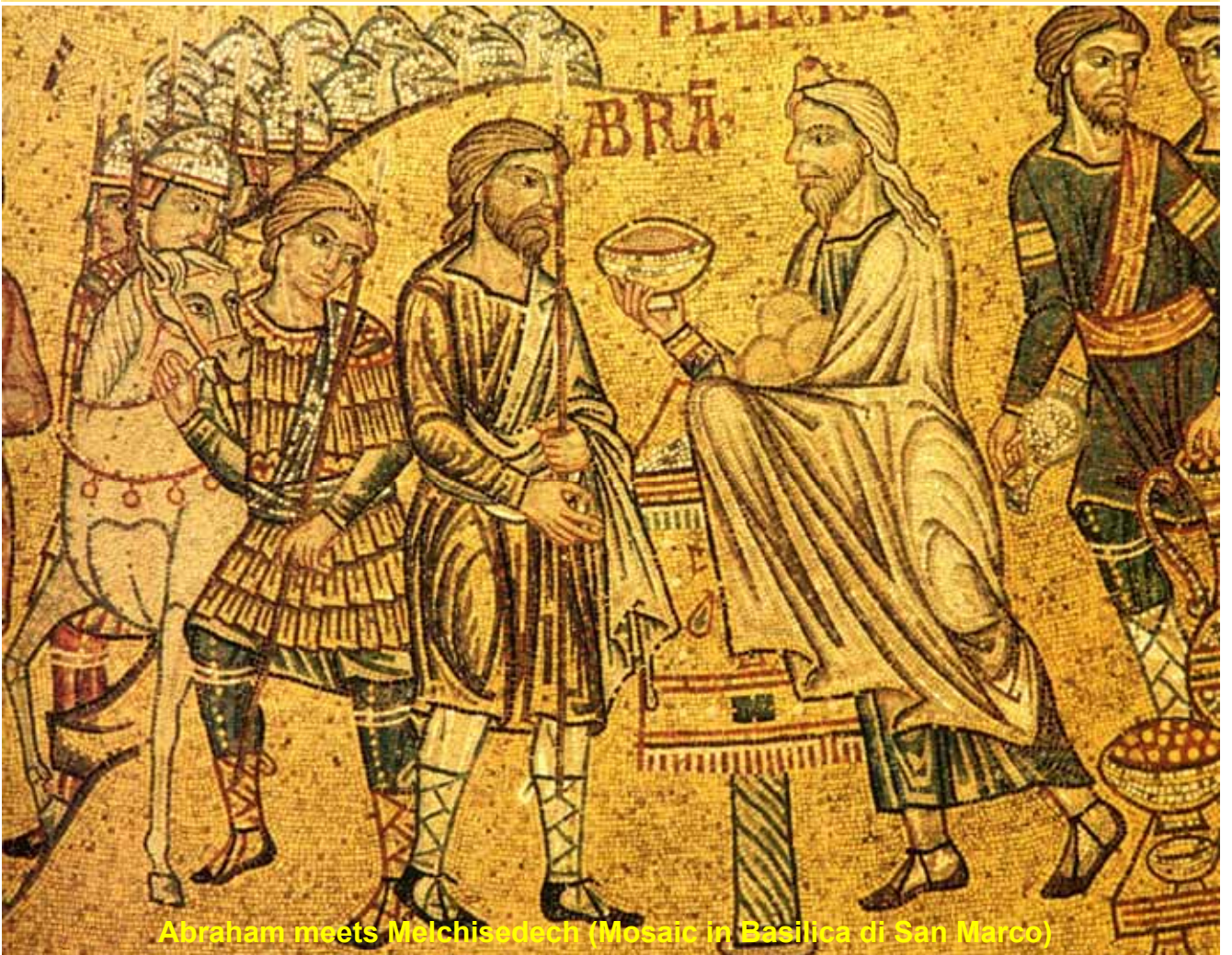
Abraham meets Melchisedech (Mosaic in Basilica di San Marco)

Der geplante dritte Tempel, einschließlich Tieropfer, während des Millenniums! Könnte das die größte und letzte Täuschung sein?