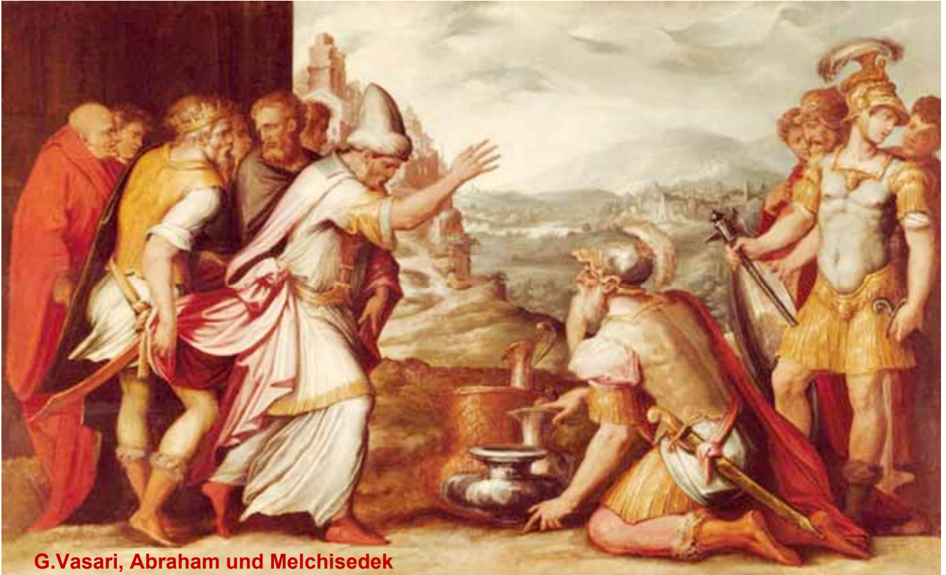
G.Vasari, Abraham und Melchisedek

Melkisetek oder Malki-Tzedik = Ein König der Rechtschaffenheit, ein König der Gerechtigkeit, ein König des Friedens